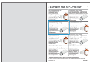
Produktetipp im Drogistenstern