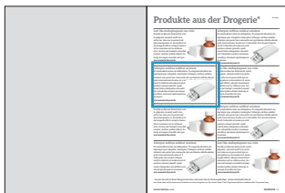
Produktetipp im Drogistenstern