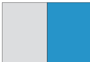
1/4-Seite-Inserat im d-inside